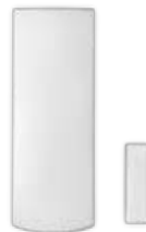
Contact de porte à longue portée (MG-DCT1)