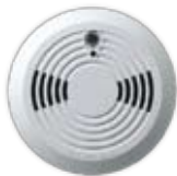
Détecteur de fumée (SD738) fabriqué par EVERday (Taiwan)†