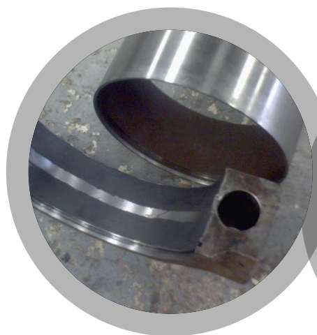
Reconstruction de logement de roulement