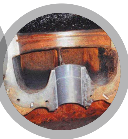
Moulage de logement de garnitures