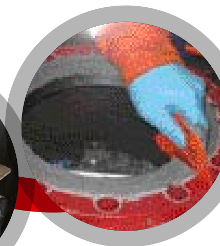
Reconstruction de bride