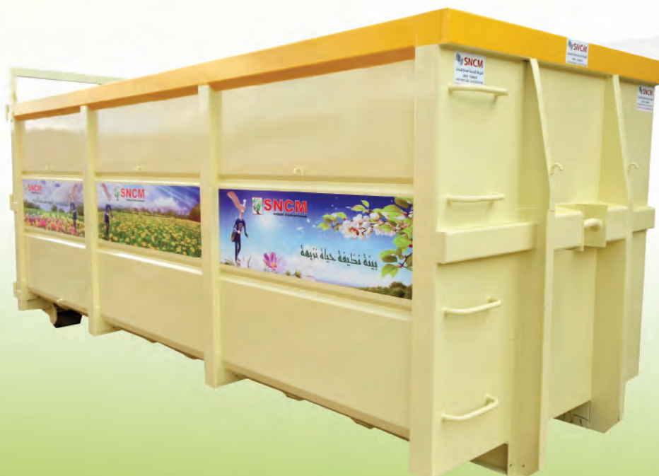
30 m 3