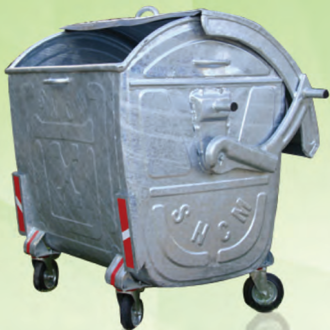
Poubelle de 1100 litres à couvercle bombé