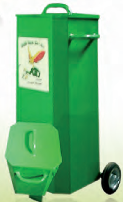
Conteneur 80 litres