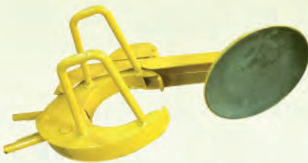
Sabot pour voiture