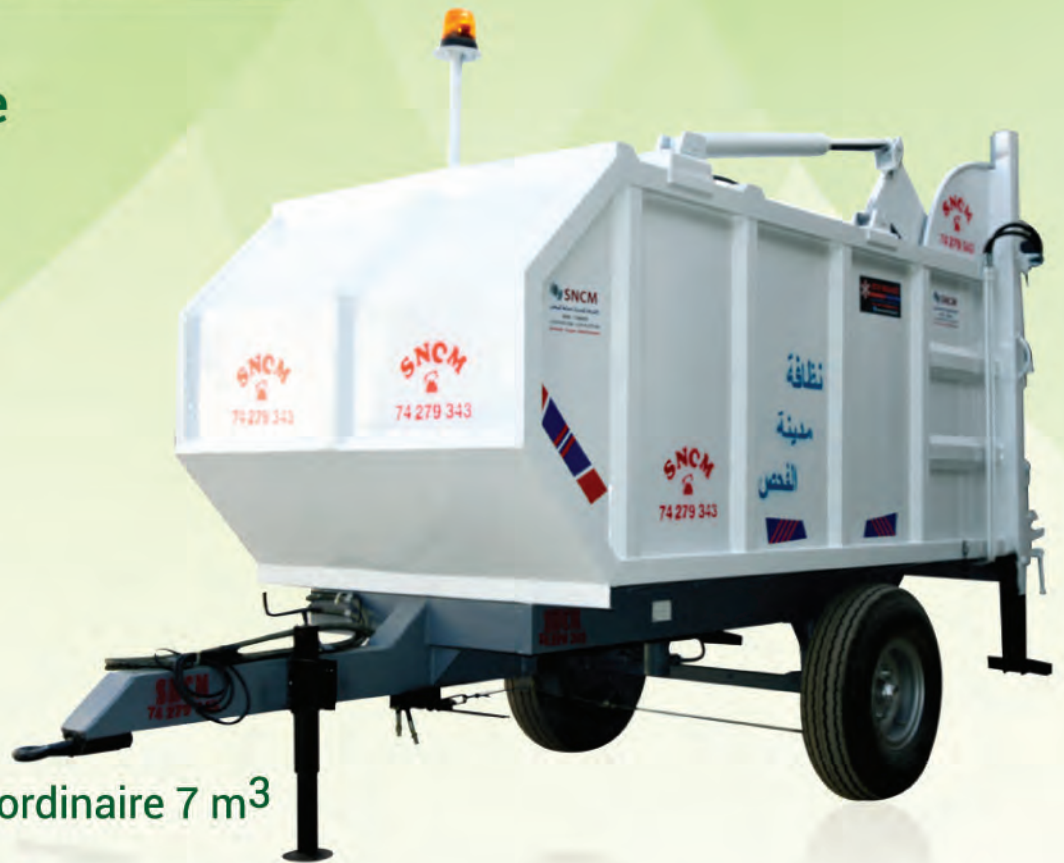
Benne Tasseuse ordinaire 7 m 3