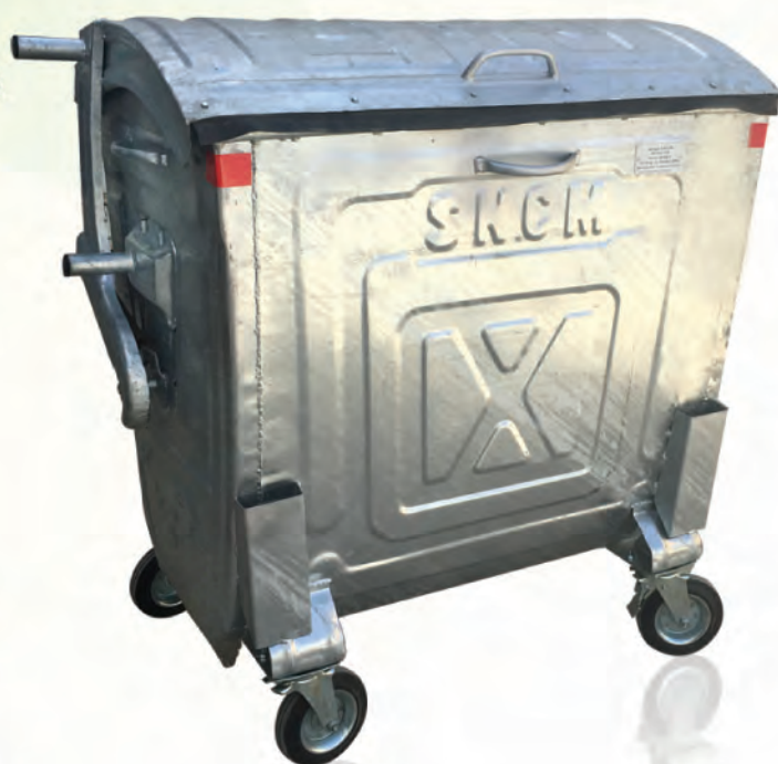
Poubelle 770 litres à couvercle bombé