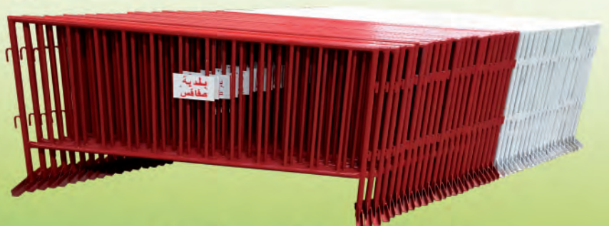
Barrières de protection