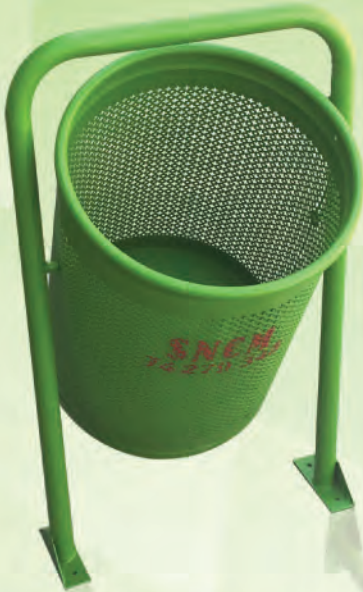
Corbeille 100 litres