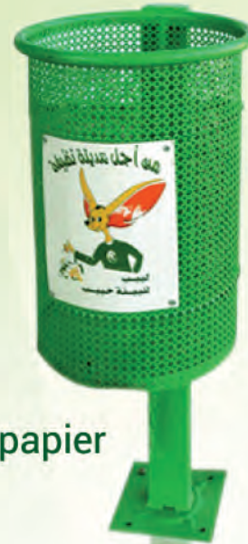
Corbeille à papier