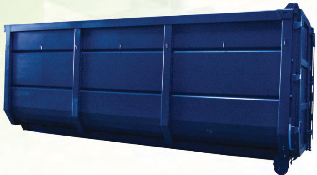
35 m 3