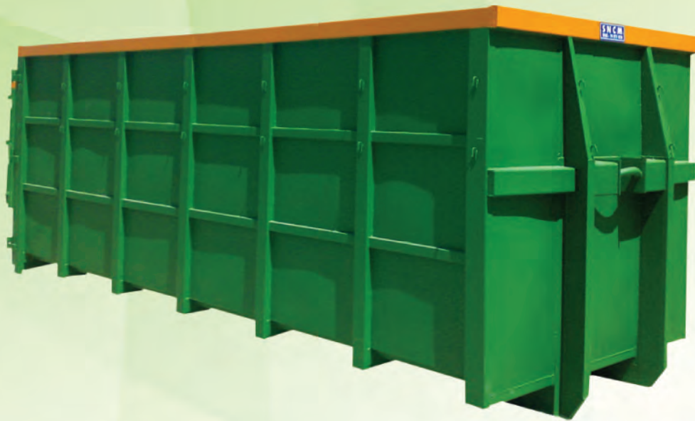
30 m 3 renforcé