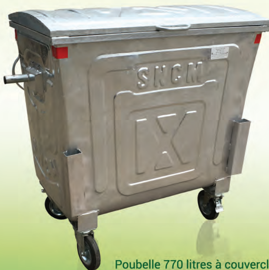
Poubelle 770 litres à couvercle plat galvanisé

Equipé de 4 roulettes pivotantes diam. 200 mm (dont 2 avec frein).