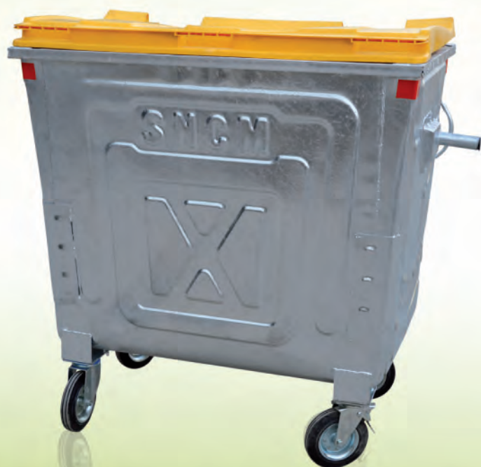
Poubelle 660 litres couvercle plat en plastique