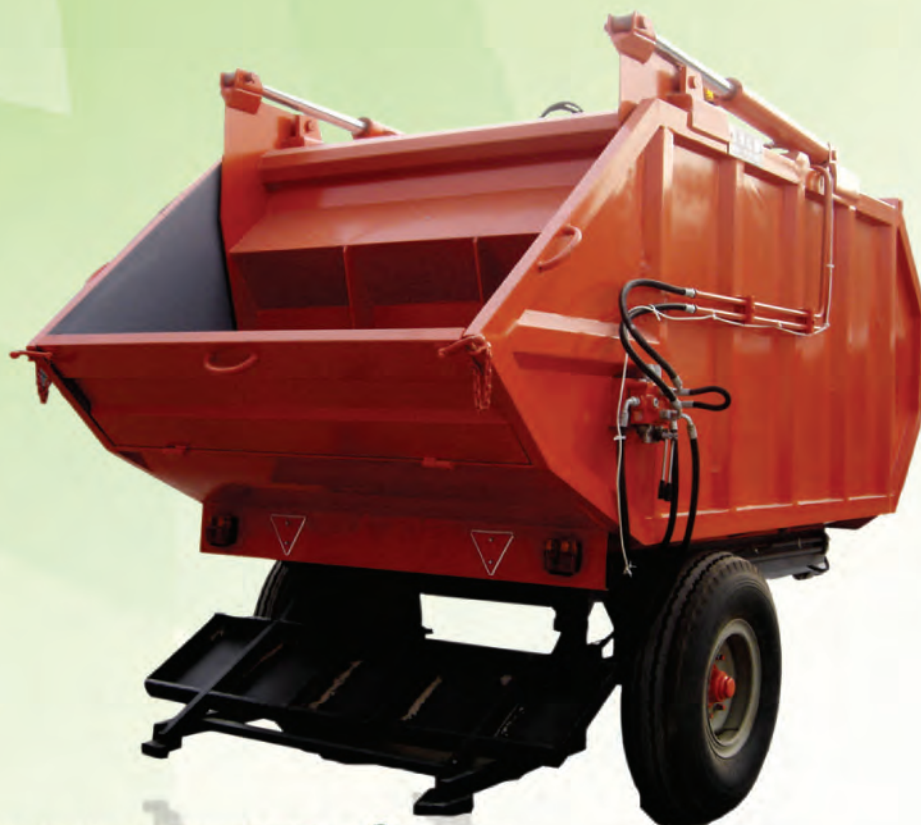
Benne Tasseuse ordinaire 7 m 3