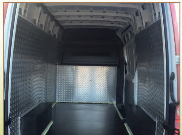
Cabine frigorifique avec hayon pour toutes les dimensions