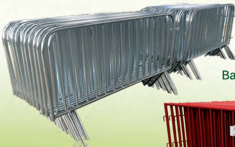
Barrière de police galvanisées